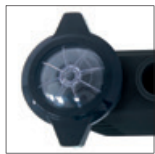
Abdeckung des Vorfilters durchsichtig