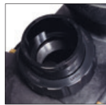
Anschlüsse im Lieferumfang enthalten (50/63 mm)