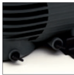
Entleerungsstopfen zum Vereinfachen der Überwinterung